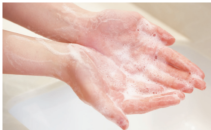
※4:ディスペンサーカートリッジは1回=約0.4mL