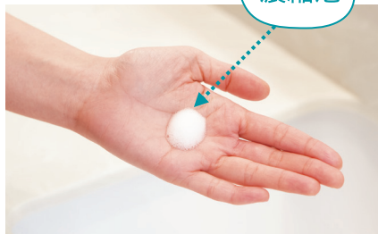
※3:従来品:1プッシュ=約1mLポンプ品